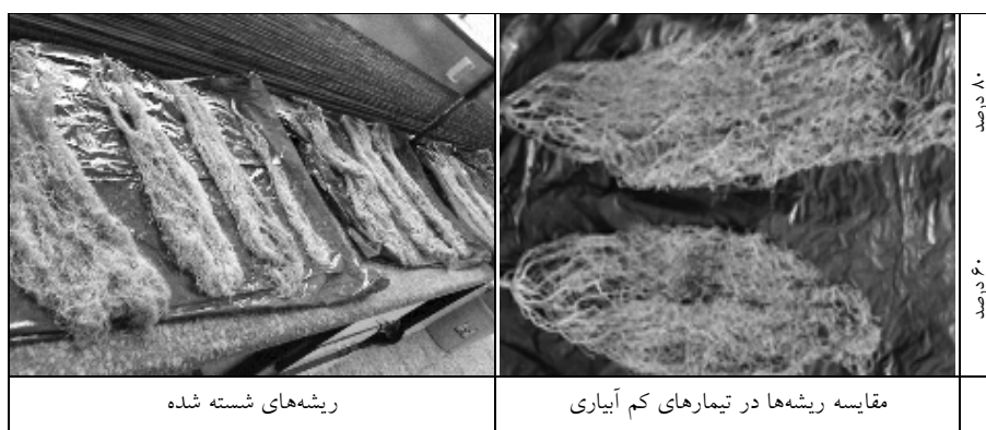
شکل 3- ریشه‌های آماده شده

است. درخصوص تیمار 40 درصد نیز، به ازای سه برابر کاهش نیاز آبی، کاهش صفات ریشه بیش از سه برابر بود. بنابراین می‌توان اعمال تیمار 80 درصدی را نسبت به تیمارهای دیگر مناسب ارزیابی کرد. در تأیید تأثیر متفاوت تنش آبی بر روی سیستم ریشه، بعد از پایان فصل رشد، همه ریشه‌ها در تیمارهای مختلف تنش آبی از خاک جدا و گسترش ظاهری آن‌ها مورد مشاهده قرار گرفت (شکل 3). مشاهدات نشان داد