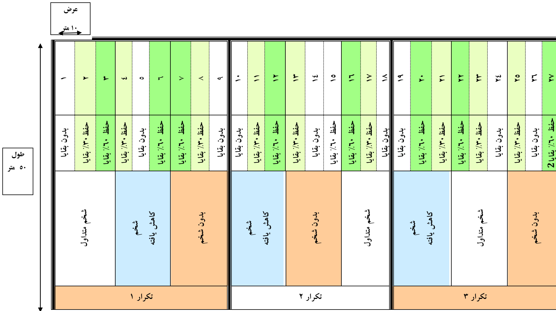
شکل ۲- نقشه تیمارهای مختلف خاک‌ورزی و مدیریت بقایا در سیستم تناوب زراعی گندم-پنبه-گندم در منطقه معتدل (کناباد)