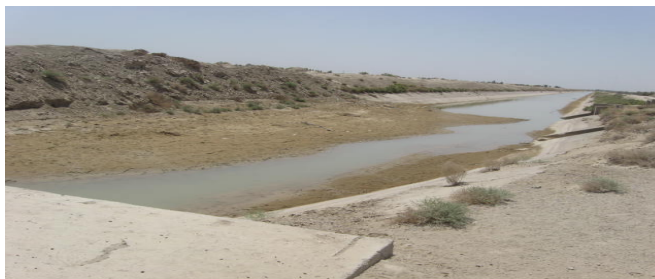
شکل ۲- کاهش ظرفیت انتقال آب توسط شبکه

مسائل عنوان شده باعث می‌شوند که راندمان انتقال و توزیع آب در شبکه های آبیاری و زهکشی بطور