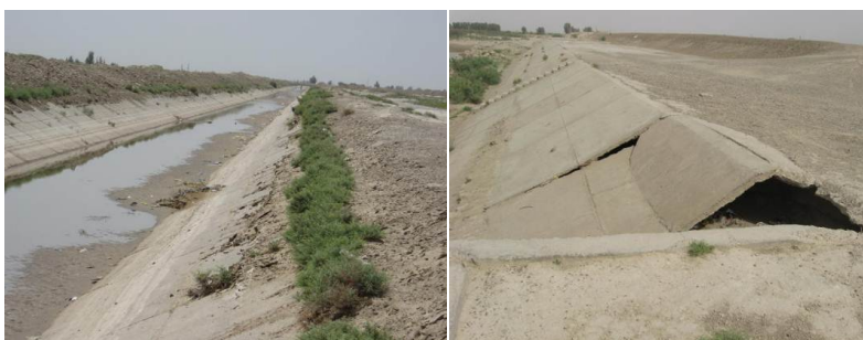
شکل ۱- تخریب شبکه کانالی

عمده ترین مشکلات فنی در شبکه های مذکور تخریب پوشش کانال به شکلهای مختلف، عملکرد نامناسب سازه های تنظیم و توزیع آب، پایین بودن راندمان شبکه شکل (۱) نمونه ای از تخریب ایجاد شده در شبکه را نشان می دهد. بدلیل تخریب و عملکرد نامناسب سازه های تنظیم و توزیع آب موجود در شبکه راندمان انتقال بسیار کمتر از حد انتظار می باشد. بطوریکه راندمان انتقال در کانالهای بتنی شبکه کمتر ۵۰٪ تعیین شده است.