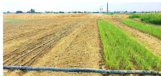
شکل ۲- کاشت نشاء و بذر در زمین اصلی

در این پژوهش از رقم برنج فجر استفاده شد. زمان کاشت بذر و انتقال نشاءها به کرت‌های آزمایشی یکسان بود. در کاشت به روش نشایی، ابتدا بذور در سینی‌های کشت نشاء آماده شدند و بعد از یک ماه با حدود ۱۲ سانتی‌متر رشد طولی به کرت‌های آزمایشی انتقال یافتند. همچنین، در روش کاشت مستقیم بذر، بذرها روی بستر با فواصل ۱۵×۲۰ سانتی‌متر و در عمق دو تا سه سانتی‌متری خاک قرار گرفتند. تراکم و زمان کاشت در همه کرت‌های آزمایشی یکسان بود (شکل ۲).