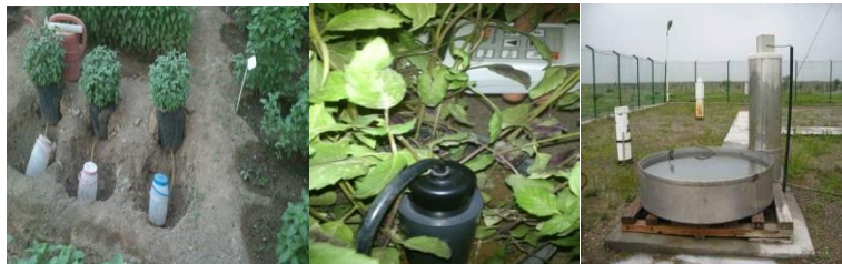
شکل ۲- نمای از سه روش اندازه‌گیری به‌ترتیب شامل میکرو لایسیمترهای پیشنهادی، تتاپروب و تشتک تبخیر کلاس A آمریکا در حال اندازه‌گیری در مزرعه آزمایشی

اطلاعات به‌صورت دو بار در روز به فواصل ۱۲ ساعت (شش صبح و شش بعد از ظهر) ثبت شد (شکل ۲). لازم به‌ذکر می‌باشد که همزمان با کشت گیاه در لایسیمتر، گیاه در مزرعه با شرایط مشابه کشت شده و در هر مرحله با اندازه‌گیری وزن گیاه، وزن آن از محاسبات بیلان آبی کسر شده است.