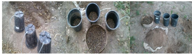
شکل ۱- مراحل ساخت و آماده‌سازی میکرو لایسیمتر وزنی- زهکش‌دار پیشنهادی

اطلاعات به‌صورت دو بار در روز به فواصل ۱۲ ساعت (شش صبح و شش بعد از ظهر) ثبت شد (شکل ۲). لازم به‌ذکر می‌باشد که همزمان با کشت گیاه در لایسیمتر، گیاه در مزرعه با شرایط مشابه کشت شده و در هر مرحله با اندازه‌گیری وزن گیاه، وزن آن از محاسبات بیلان آبی کسر شده است.